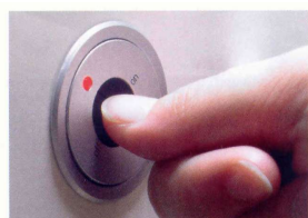
Montaje con anilla de inserción

El nuevo sistema de dirección de la luz por radio X-Mitter permite un direccionamiento confortable y sin cables de las lámparas y demás aparatos de la clase de protección II con enchufe plano euro.