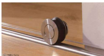
SV-I120 U Terra

Se trata de un mecanismo de divisiones y puertas de vidrio, con dos rodamientos dobles de acero inoxidable, para puertas correderas de cristal, dobles y simples, de hasta 120 kg de peso, para vidrios de entre 8 y 10 mm, especialmente indicado para puertas de paso e instalaciones de duchas en baños.