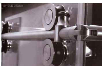
SV-I120 U Doble

Se trata de un mecanismo de divisiones y puertas de vidrio, con un rodamiento de acero inoxidable, para puertas correderas de cristal, dobles y simples, de hasta 120 kg de peso, para vidrios de entre 8 y 10 mm, especialmente indicado para puertas de paso e instalaciones de duchas en baños.