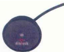
Antena / Lector

Terminal de control que se monta oculta dentro del mueble. Controla hasta 11 cerraduras electromecánicas. Emite señales acústicas a la apertura y cierre.