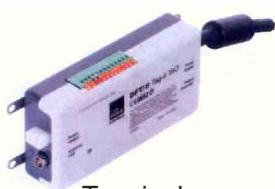
Terminal Unidad de control

Cerradura electromecánica para bloquear la puerta del mueble. En ausencia de corriente la puerta queda cerrada. Cuando recibe el impulso eléctrico, se abre en 3 segundos, pasados estos se cierra automáticamente.