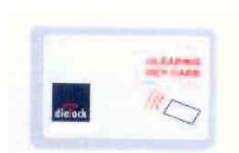
Tarjeta de programación roja