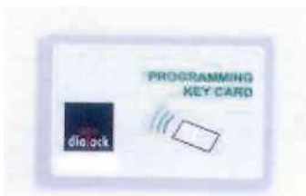
Tarjeta de programación verde

Cerradura electrónica para mueble. Funcionamiento con batería. Al presentar la tarjeta de proximidad la cerradura se abre. Con la tarjeta de programación se pueden dar de alta o baja a los distintos usuarios.